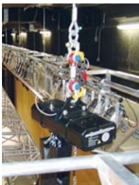
BGV-C1-Kettenzug von Chainmaster mit Kraftmessdose

Der proTouch StageOperator wurde von den sächsischen Entwicklern für den Einrichtbetrieb von Hebezeugen konzipiert. In Verbindung mit den verlinkbaren vier- und achtkanaligen Motorunterverteilungen können Elektrokettzüge, Seilwinden, Vorhanganlagen oder auch Rohrwellenzüge gesteuert werden. Das Touchpanel verwaltet bis zu 48 Kanäle und besitzt eine integrierte Gruppenabschaltung, welche im Ansprechen der Sicherheitseinrichtung eines Kettenzuges die gesamte Gruppe der Kettenzüge stillsetzt. Der proTouch StageOperator ist in der Lage, alle Endschalter der Kettenzüge, einen im Kettenzug eingebauten Inkremental- oder Absolutwertgeber, eine Kraftmessdose oder digitale Über- und Unterlastsignale auszuwerten. Darüber hinaus wird der Status der Motorunterverteilungen, die Position der Kettenzüge, die jeweilige Traglast, sowie Fehlermeldungen der Kettenzüge wie etwa das Ansprechen einer Sicherheitseinrichtung angezeigt. Die wichtigsten Funktionen wie Heben, Senken, Zielfahrten oder Überbrückung der